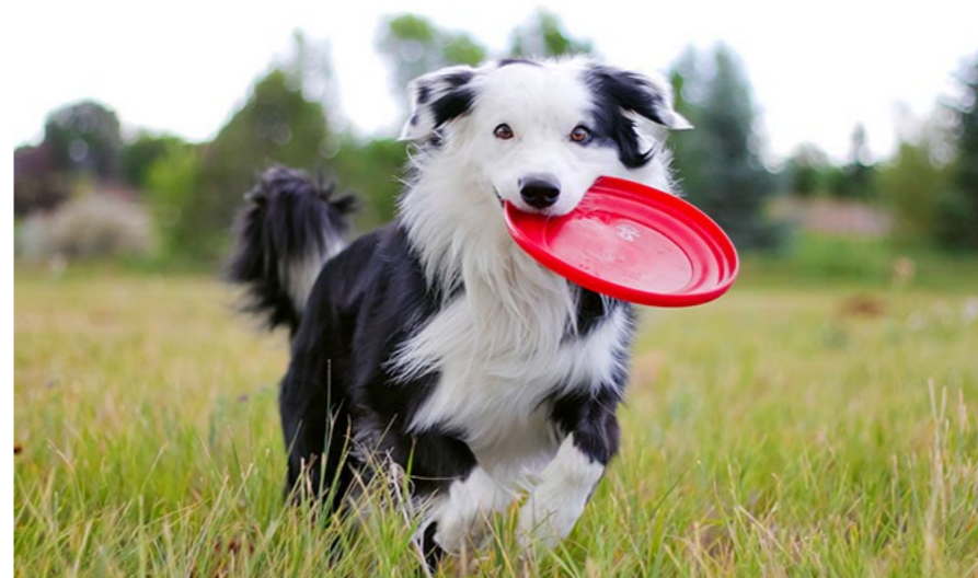
Dette er en leken Border collie. På landet, men samtidig i byen.

Border collien har et stort og bredt hode. Den har midtens lange ører som henger ned. Den er intelligent og tålmodig. Den er den mest populære hunden i Norge i år (2017) ifølge Aftenposten.